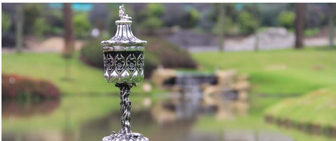
Javier Claux Presidente Federación Peruana de Golf

Nuestro reconocimiento desde aquí a todas las instituciones y personas que harán hecho posible este evento, y esperamos que al regreso a sus países tengan muchas anécdotas interesantes y positivas sobre su visita al Perú.