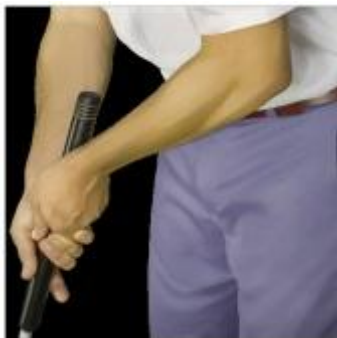
Putter de barriga

NO. Un jugador puede utilizar cualquier putter de barriga o putter largo. La Regla 10.1b solo habla de la forma de golpear y prohíbe que un jugador ancle el palo directamente o mediante un punto de anclaje al ejecutar el golpe.