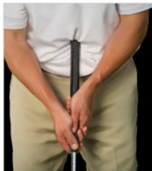
Putter de barriga

Las siguientes imágenes muestran los tipos de golpes más comunes que se prohíben bajo esta Regla.