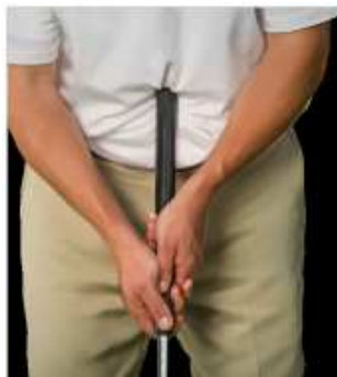
Putter de barriga

Las siguientes imágenes muestran los tipos de golpes más comunes que se prohíben bajo esta Regla.