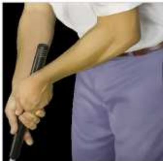
Putter de barriga

NO. Un jugador puede utilizar cualquier putter de barriga o putter largo. La Regla 14-1b solo habla de la forma de golpear y prohíbe que un jugador ancle el palo directamente o mediante un punto de anclaje al ejecutar el golpe.